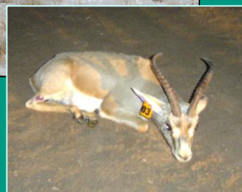
آهوی نر پس از زنده گیری و رهاسازی